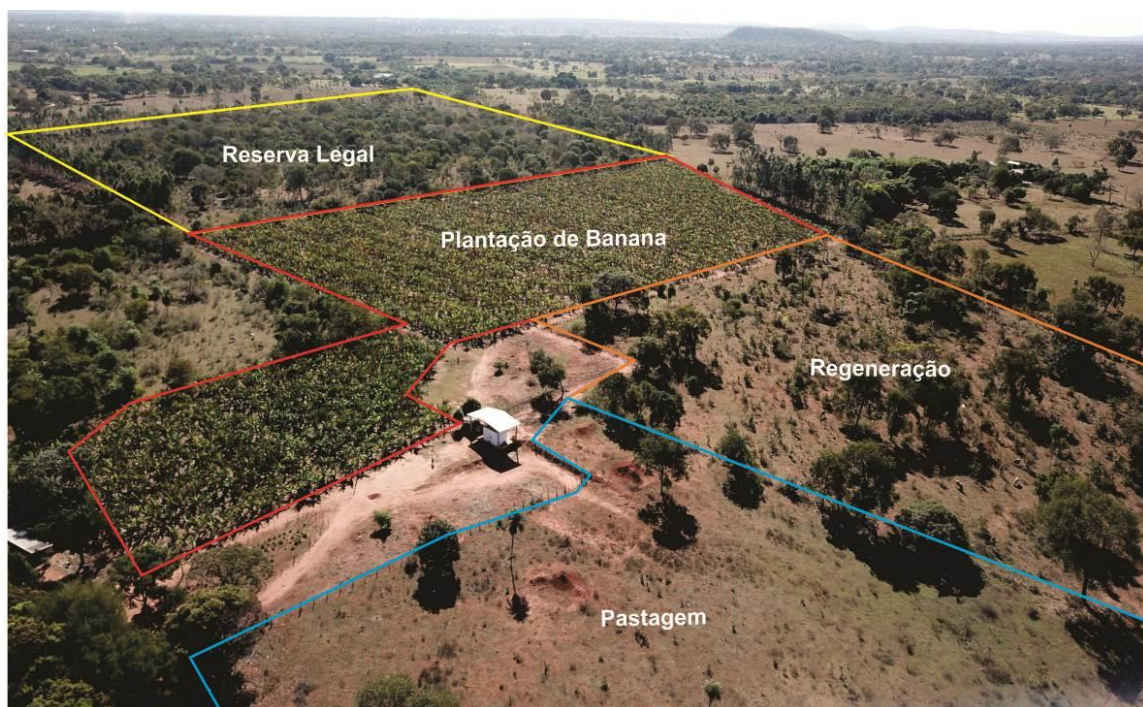
Figura 1: Imagem aérea da área de estudo dentro da propriedade rural com suas respectivas classificações: pastagem em linha azul, plantação de banana delimitada em vermelho, reserva legal circundada em amarelo e área em regeneração traçada em laranja.