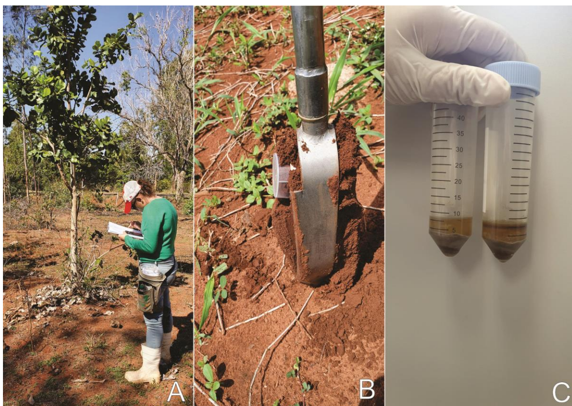
Figura 2: Procedimentos realizados em campo e laboratório para levantamento botânico da vegetação que ocorre em cada área amostrada. A) Georreferenciamento e identificação de espécies; B) Coleta de solo; C) Separação dos grãos de pólen da amostra de solo.

As amostras de solo receberam o seguinte tratamento químico conforme especificado no trabalho de Freitas et al., (2022) com adaptações (Figura 2c). Posteriormente, os tipos polínicos com auxílio de literatura especializada de Barth & Melhem (1988) e Punt et al. (2007), complementada por Dias (2006), Plá-Junior et al. (2006), Silva (2007), Silva (2014), Martins (2010) e Chupil (2013) e outras.